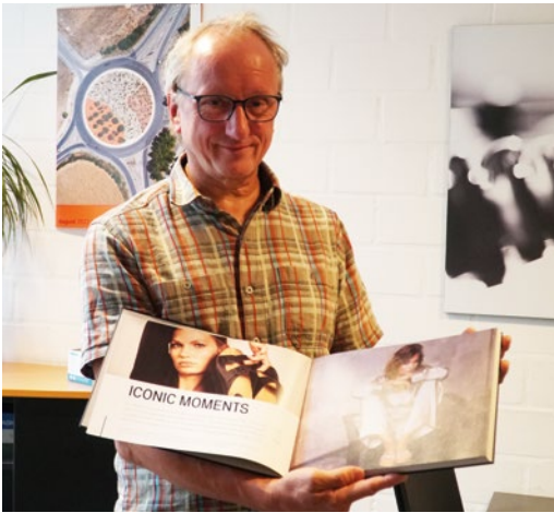
Digital gedruckt und veredelt: Auch der Buchblock dieses in kleiner Auflage produzierten Buches entstand auf der Ricoh Pro C7200x.

und fügt mit Blick auf die Online-Anbieter hinzu: „So etwas bekommt man im Internet nicht.“ Dabei hilft auch die gute Leistung und Standfestigkeit der Ricoh Pro C7200x sowie die noch einmal verbesserte Passerhaltigkeit gegenüber der Vorgängermaschine. Stork: „Wir haben uns vor der Anschaffung natürlich auch Maschinen anderer Hersteller angesehen. Doch die Ricoh überzeugte uns am Ende mit ihrer kompakten, robusten Bauweise. Die Preisgestaltung und der Service von Wessler taten ihr Übriges.“