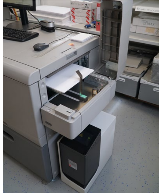
Der Banneranleger der Ricoh Pro C7200x wird bei Schröerlücke gerne für ungewöhnliche Druckprodukte genutzt, die vom Format her aus der Reihe fallen.

Druck: Schröerlücke www.schroerluecke.de Hubertus Wessler www.wessler.com