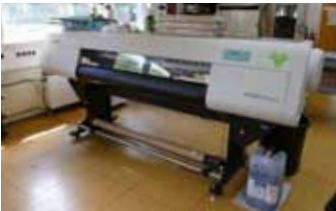
Mit einer guten Ausrüstung für das Large Format Printing oder das Laserschneiden und -gravieren kann Satzdruck auch große oder ausgefallene Ideen seiner Kunden professionell umsetzen. Großformate und filigrane Laserschnitte sind angesagt.