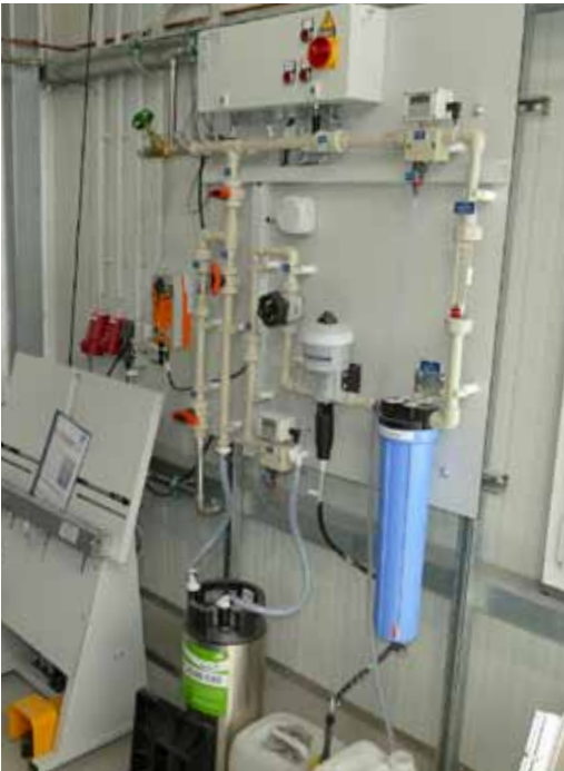
Feuchtmittel und Reinwasser für Wascheinrichtungen benötigen optimale Wasserqualität. Die mit eingebrachte Feuchtwasser-Aufbereitungs-Anlage „Drucktech print DIA“ von EnviroFalk gewährleistet dies jetzt bei Satzdruck.